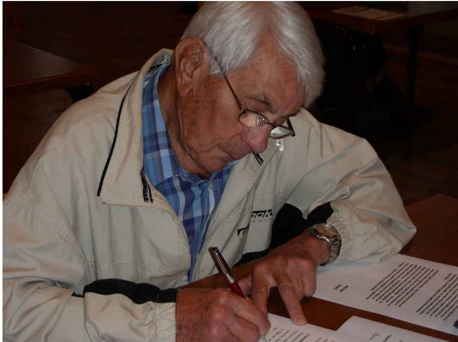
Le Doyen !