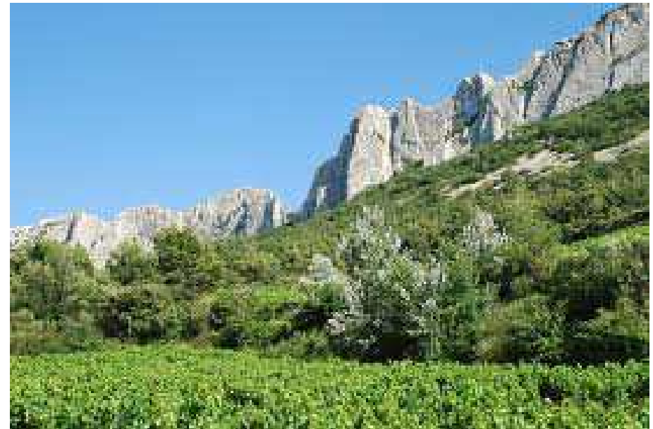
Dentelles de Montmirail