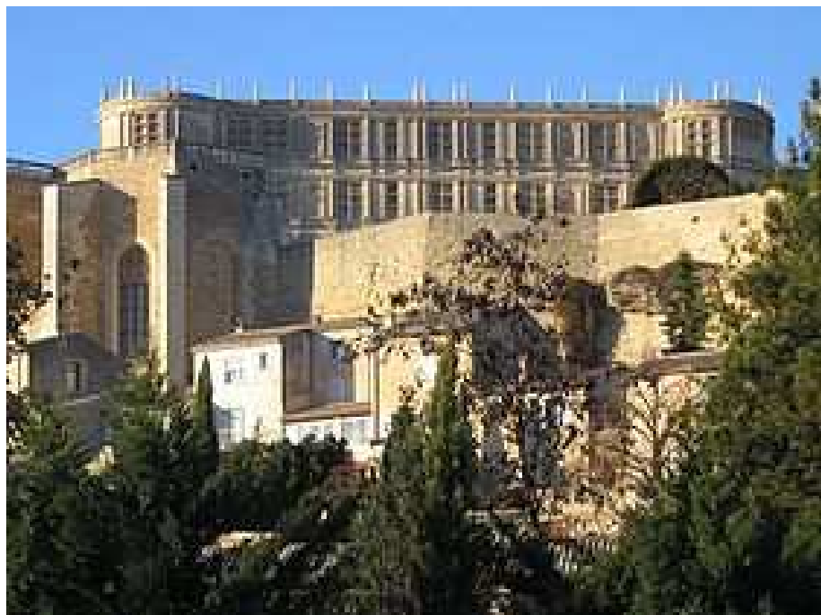
Chateau de Grignan

21 / 23 SEPTEMBRE : Découverte de la Drôme Provençale